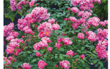
Rosa 'MEIRIFTDAY' PPAF CBRAF

Para ver preguntas e instrucciones de cuidado completas, visita ProvenWinners.com/ShrubCare