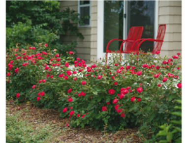
Rosa 'Meipeporia' PP#26298

Para ver preguntas e instrucciones de cuidado completas, visita ProvenWinners.com/ShrubCare