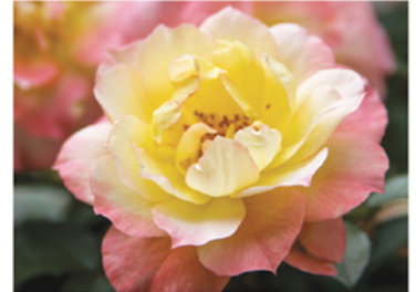
Rosa 'Chewnicebell' PP#26532 CBR#5131

Para ver preguntas e instrucciones de cuidado completas, visita ProvenWinners.com/ShrubCare