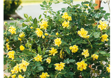
Rosa 'Chewhocan' PP#26914 CBR#5130

Para ver preguntas e instrucciones de cuidado completas, visita ProvenWinners.com/ShrubCare