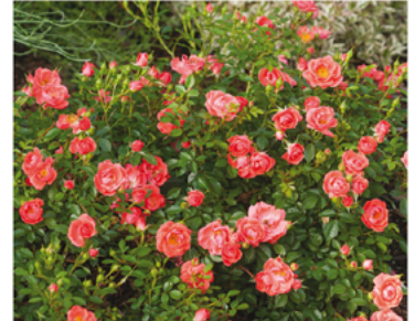
Rosa 'ChewperAdventure' PP#22190 CBR#4688

Para ver preguntas e instrucciones de cuidado completas, visita ProvenWinners.com/ShrubCare