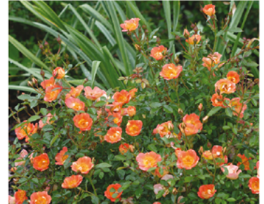
Rosa 'ChewMayTime' PP#18347 CBR#3401

Para ver preguntas e instrucciones de cuidado completas, visita ProvenWinners.com/ShrubCare