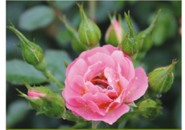
Rosa 'ZLEMarianneYoshida' PP#22205 CBR#4448

Para ver preguntas e instrucciones de cuidado completas, visita ProvenWinners.com/ShrubCare