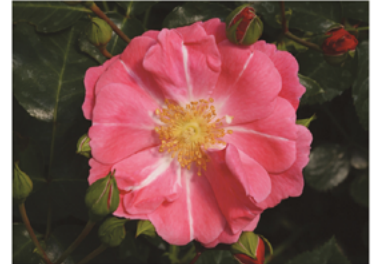
Rosa 'Chewallbell' PP#26817 CBR#5129

Para ver preguntas e instrucciones de cuidado completas, visita ProvenWinners.com/ShrubCare