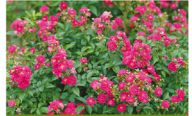
Rosa 'Phyllis Sherman' PP#29167 CBRAF

Para ver preguntas e instrucciones de cuidado completas, visita ProvenWinners.com/ShrubCare