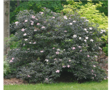
Sambucus nigra 'Gerda' PP#12305

Para ver preguntas e instrucciones de cuidado completas, visita ProvenWinners.com/ShrubCare