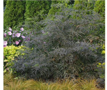
Sambucus nigra 'Eva' PP#15575 CBR#2633

Para ver preguntas e instrucciones de cuidado completas, visita ProvenWinners.com/ShrubCare