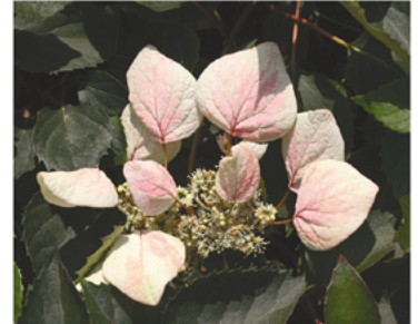
Schizophragma hydrangeoides 'Minsens'

Para ver preguntas e instrucciones de cuidado completas, visita ProvenWinners.com/ShrubCare