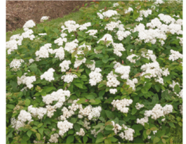
Spirea media "SMSMBK" PP#26655 CBRAF

Para ver preguntas e instrucciones de cuidado completas, visita ProvenWinners.com/ShrubCare