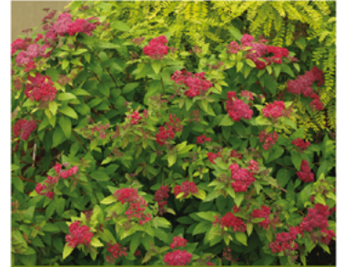
Spiraea japonica 'SMNSJMFR' PP#26993 CBR#5633

Para ver preguntas e instrucciones de cuidado completas, visita ProvenWinners.com/ShrubCare