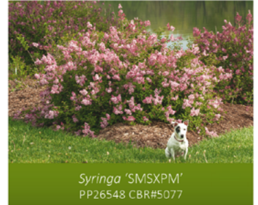
Syringa 'SMSXPM' PP26548 CBR#5077

Para ver preguntas e instrucciones de cuidado completas, visita ProvenWinners.com/ShrubCare