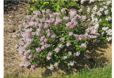
Syringa 'SMNSDTP' PPAF CBRAF

Para ver preguntas e instrucciones de cuidado completas, visita ProvenWinners.com/ShrubCare