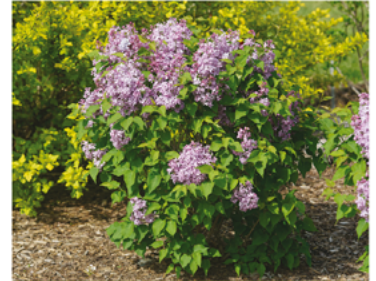
Syringa x hyacinthiflora 'SMNSHSO' PPAF CBRAF

Para ver preguntas e instrucciones de cuidado completas, visita ProvenWinners.com/ShrubCare