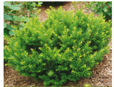
Taxus x media 'SMNTHDB' PPAF CBRAF

Para ver preguntas e instrucciones de cuidado completas, visita ProvenWinners.com/ShrubCare