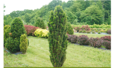
Taxus x media 'SMNTHDPF' PPAF CBRAF

Para ver preguntas e instrucciones de cuidado completas, visita ProvenWinners.com/ShrubCare