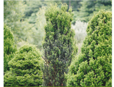
Taxus x media 'SMNTHDC' PPAF CBRAF

Para ver preguntas e instrucciones de cuidado completas, visita ProvenWinners.com/ShrubCare