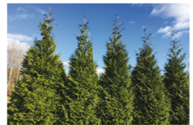
Thuja plicata 'Grovepl'

Para ver preguntas e instrucciones de cuidado completas, visita ProvenWinners.com/ShrubCare