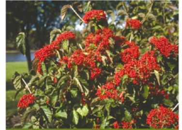
Viburnum dilatatum 'Henneke' PPH12870

Para ver preguntas e instrucciones de cuidado completas, visita ProvenWinners.com/ShrubCare