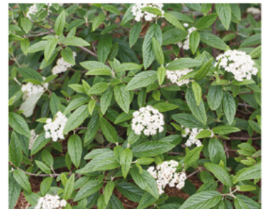
Viburnum x rhytidophylloides 'NCVR.1' PP#28094

Para ver preguntas e instrucciones de cuidado completas, visita ProvenWinners.com/ShrubCare