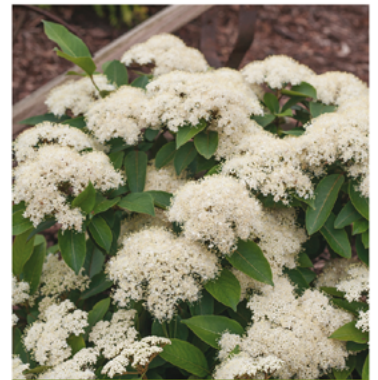
Viburnum cassinoides 'SMNVCCD' PP#27549 CBRAF

Para ver preguntas e instrucciones de cuidado completas, visita ProvenWinners.com/ShrubCare