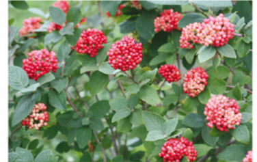
Viburnum 'Redell' PP#24227 CBR#4913

Para ver preguntas e instrucciones de cuidado completas, visita ProvenWinners.com/ShrubCare