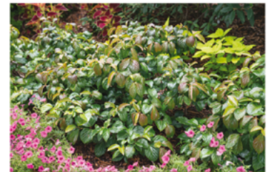
Viburnum 'NCVX1' PP#28095

Para ver preguntas e instrucciones de cuidado completas, visita ProvenWinners.com/ShrubCare