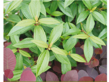
Viburnum davidii 'NCVX3' PPAF CBRAF

Para ver preguntas e instrucciones de cuidado completas, visita ProvenWinners.com/ShrubCare