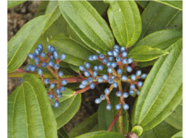
Viburnum davidii 'NCVX2' PPAF CBRAF

Para ver preguntas e instrucciones de cuidado completas, visita ProvenWinners.com/ShrubCare