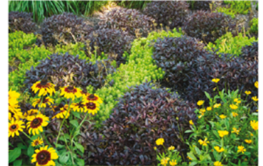
Weigela florida 'Elvera' PP#12217 CBR#2643

Para ver preguntas e instrucciones de cuidado completas, visita ProvenWinners.com/ShrubCare