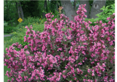
Weigela florida 'Alexandra' PP#10772 CBR#2642

Para ver preguntas e instrucciones de cuidado completas, visita ProvenWinners.com/ShrubCare