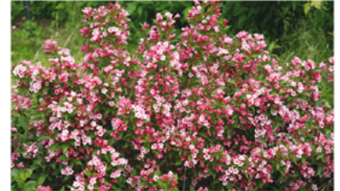
Weigela florida 'VUKOZ90345' PPAF CBRAF

Para ver preguntas e instrucciones de cuidado completas, visita ProvenWinners.com/ShrubCare